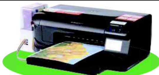
機種:Officejet Pro 8100

月額料金10,000円(税別)でプリンターレンタル。インク2セット(合計8本)を無料で使えます。 カラー印刷1枚当り約 1.6円 も実現可能です。(インクタンク1セット当り約3,000枚印刷可能)